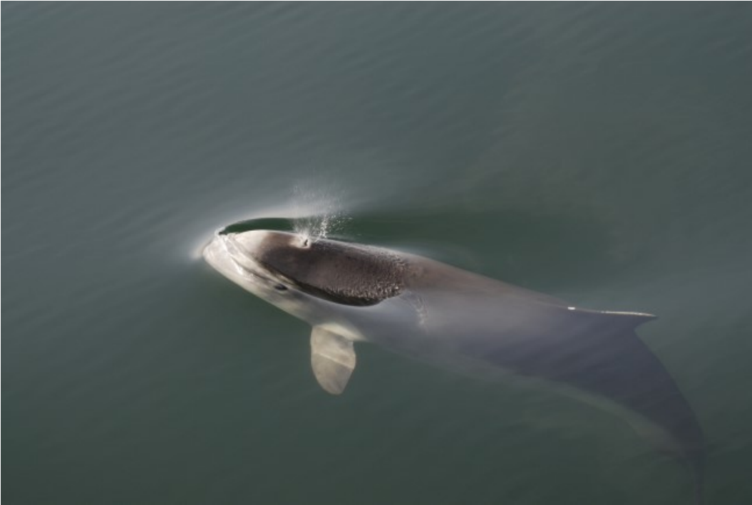
En af arterne, man finder i området, er blandt andet marsvin.

Natura 2000-området ligger syd og øst for Als. Det strækker sig fra Rinkenæs i Flensborg Inderfjord i vest til Ærø og Lyø i øst. Området har dybder mellem 0 og 40 m. Hele området er marint og bugter og vige er den mest udbredte naturtype i Natura 2000-området efterfulgt af stenrev og sandbanke. For naturtyperne bugter og vige samt stenrev er der tale om mere end 5 % af det samlede arealer i den baltiske bigeografiske region i Danmark.