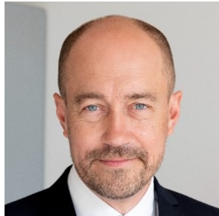
Miljøminister Magnus Heunicke

Natura 2000-områder rummer nogle af Europas og Danmarks største og mest værdifulde naturområder og repræsenterer en stor del af biodiversiteten. De danske Natura 2000-områder bidrager til det fælles EU-mål om 30 pct. beskyttet natur på land og til havs.